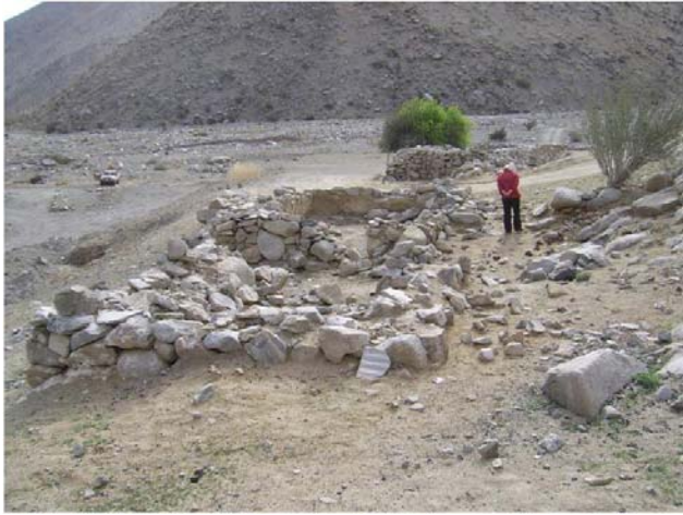
Recinto compuesto lateral