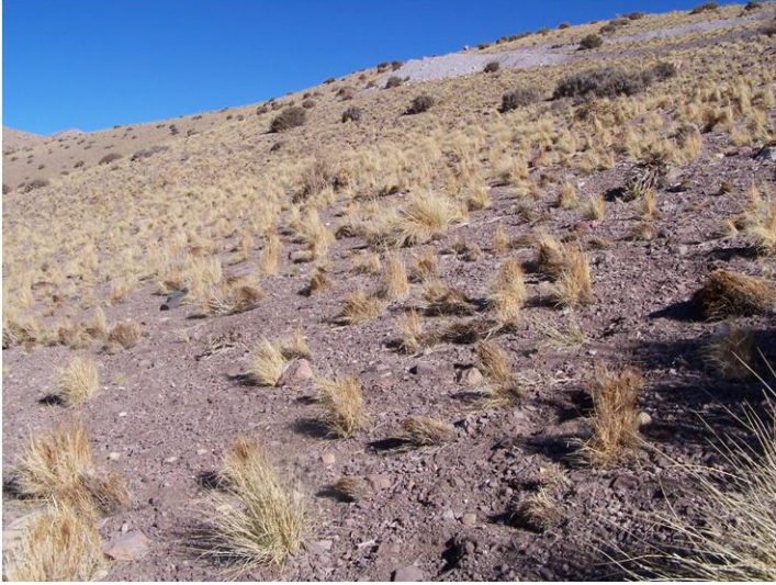
Fotografía 2.27. Hallazgo N°54.