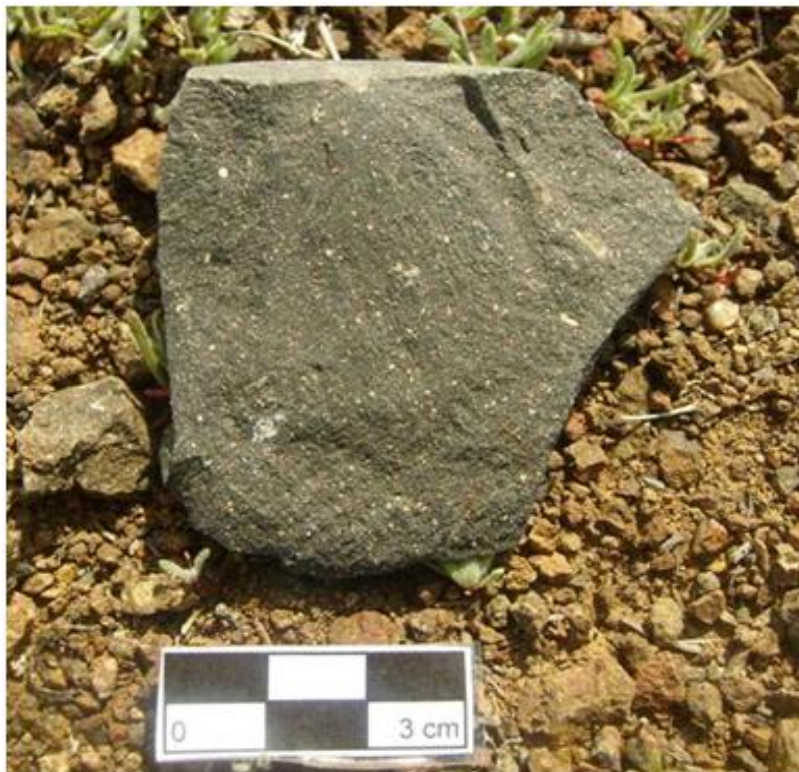
Tabla 2.47 Hallazgo N°22.