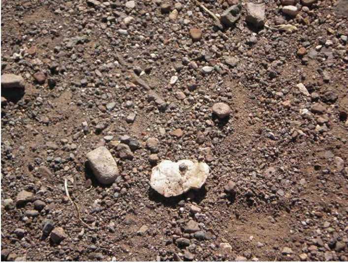
Fotografía 2.39. Hallazgo N°66.