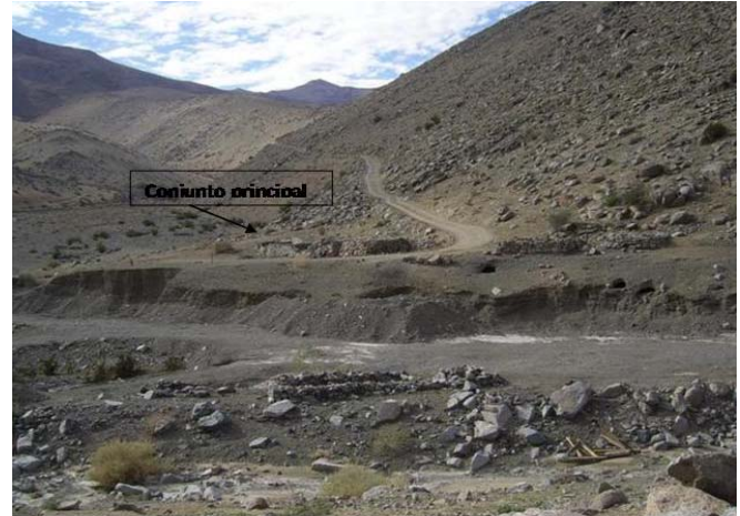
Camino que interviene