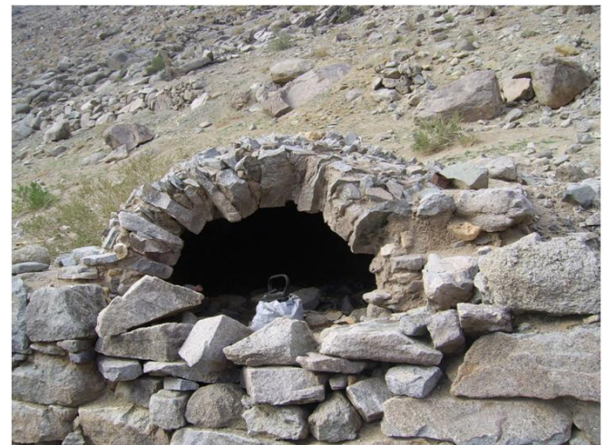
Horno en conjunto principal