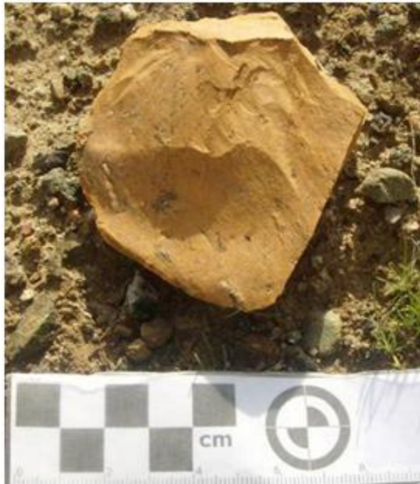
Tabla 2.45. Hallazgo N°21.