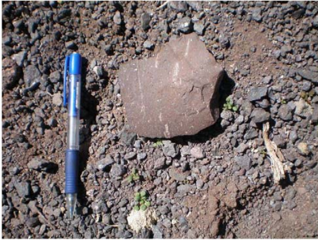
Fotografía 2.40. Hallazgo N°67.