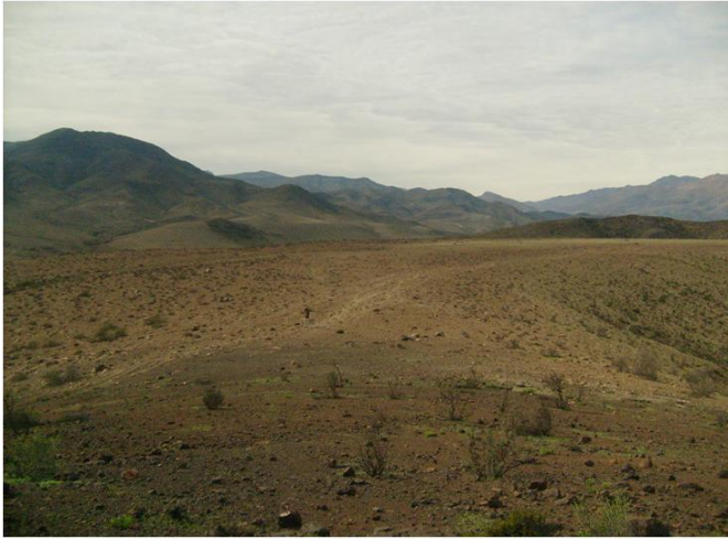
Fotografía 2.1. Hallazgo N°25.