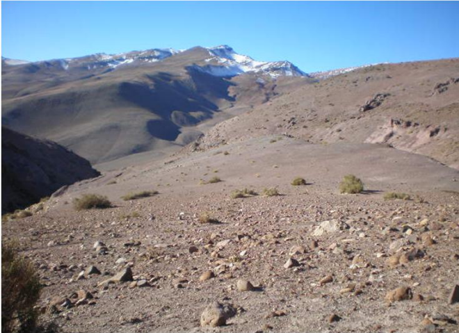
Fotografía 2.46. Hallazgo N°73.