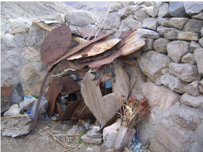
Tumba o animita