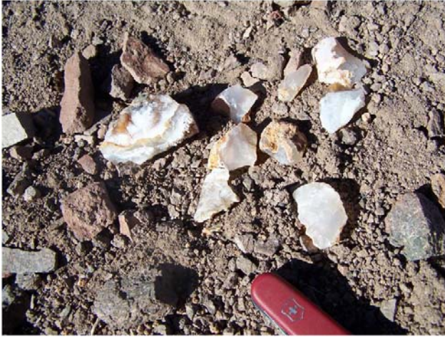
Fotografía 2.26. Hallazgo N°53.