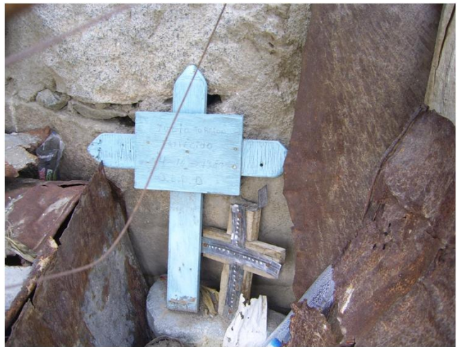
Tumba o animita