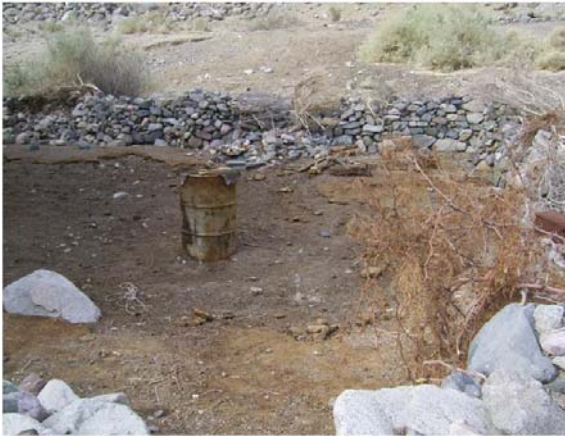
Piso del corral