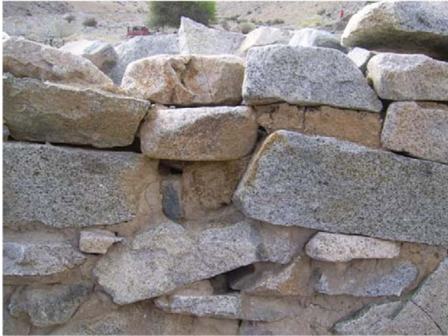
Muro con argamasa