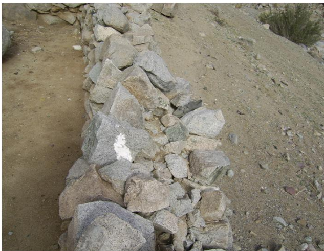
Doble hilada con relleno