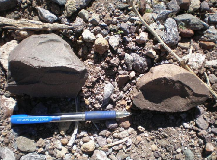
Fotografía 2.42. Hallazgo N°69.