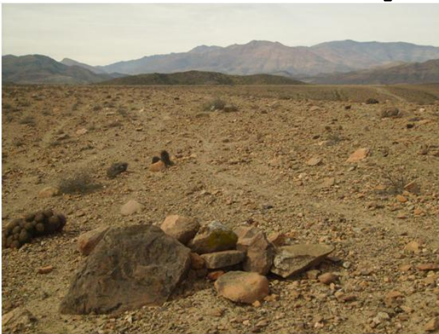
Fotografía 2.9. Hallazgo N°34.