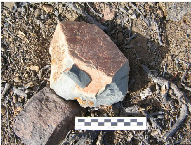
Tabla 2.41. Hallazgo N°18.