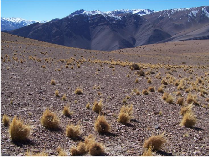
Fotografía 2.30. Hallazgo N°57.