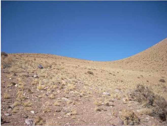
Fotografía 2.36. Hallazgo N°63.