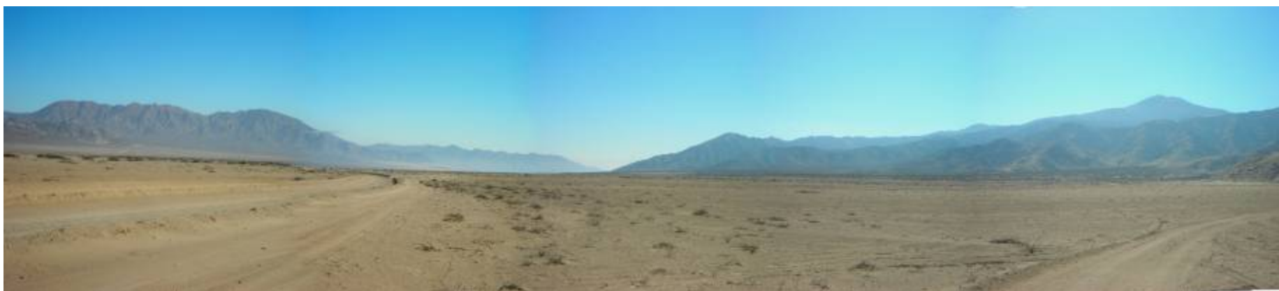
Fotografía 5.16-30: Vista al norte en Unidad de Paisaje Llano Seco. Vistas amplias