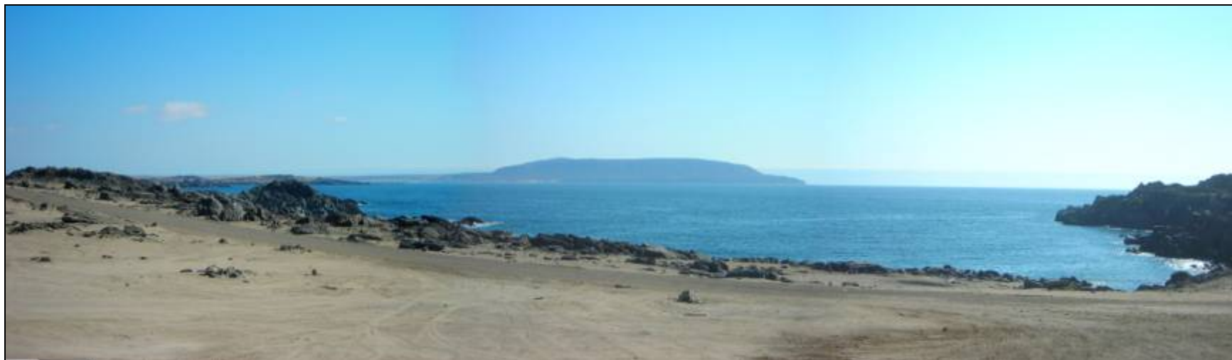
Fotografía 5.16-3: Vista al sur. Unidad de Paisaje Litoral Punta Caldera-Punta Zorro. Al fondo Morro Copiapó.