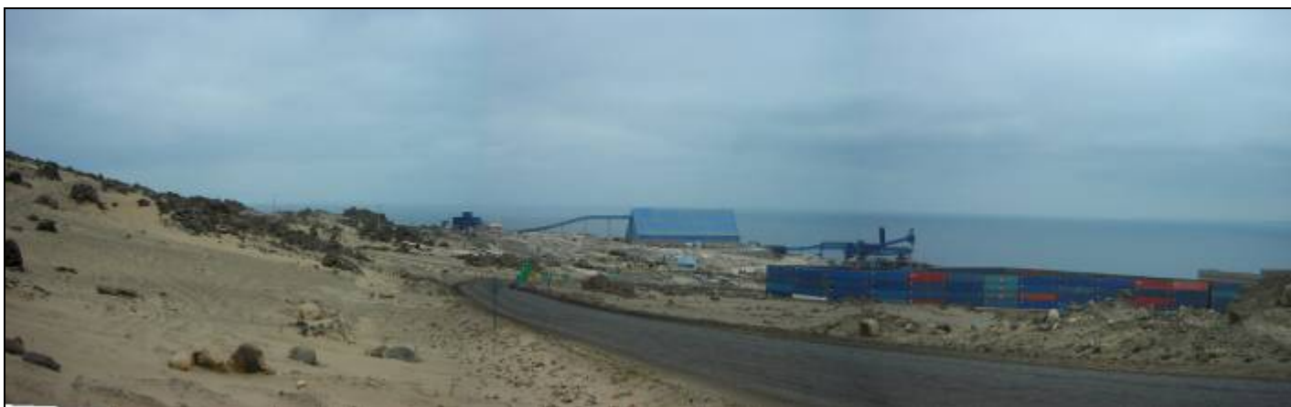
Fotografía 5.16-5: Vista al noroeste hacia el Puerto de Punta Padrones. Unidad de Paisaje Puerto Punta Padrones