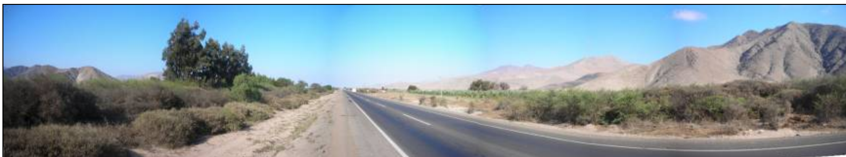
Fotografía 5.16-13: Vista al oeste desde sector San Juan –Dos Hermanas en Subunidad Valle Río Copiapó sector Monte Amargo-Piedra Colgada. A la derecha cordones de cerros de Sierra Piedra Colgada.