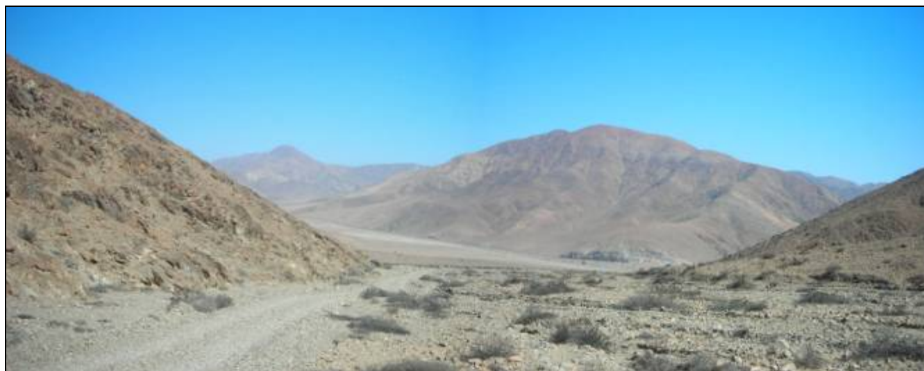
Fotografía 5.16-28: Vista hacia el oeste. Al fondo Ruta C-386. Unidad Baja Montaña en Cordón de Cerros Monardes.