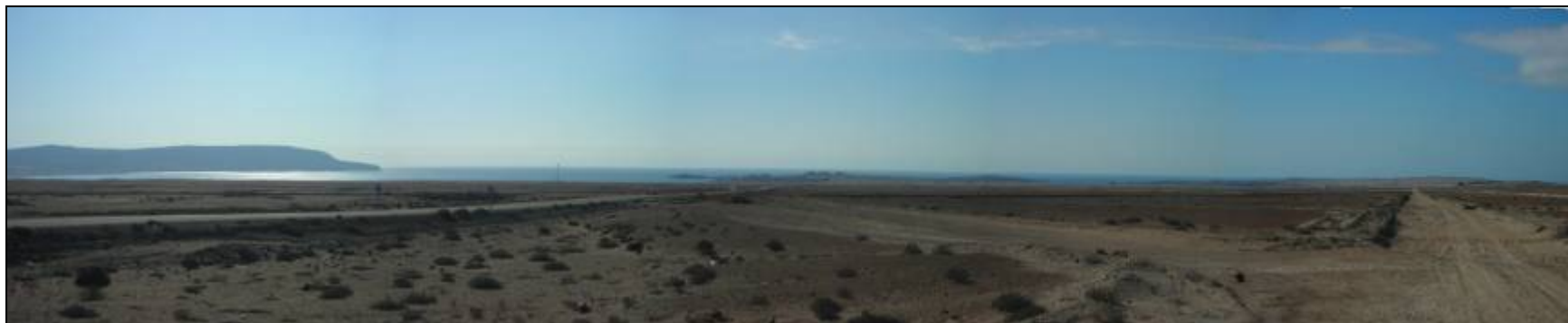
Fotografía 5.16-8: Vista al oeste. Unidad de Paisaje Litoral y Costa Bahía Inglesa. A la Izquierda Morro Copiapó.