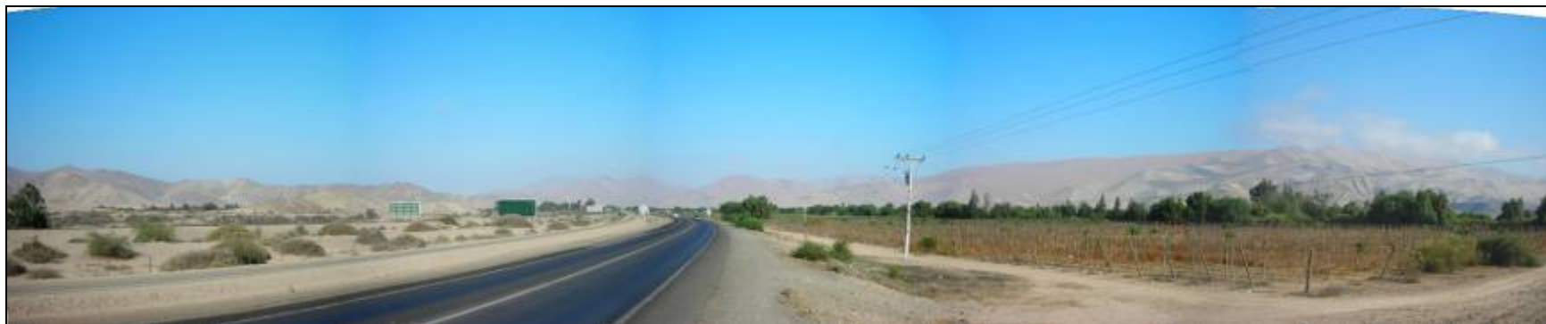
Fotografía 5.16-14: Vista al oeste desde sector Chamonate en Subunidad de Paisaje Valle Río Copiapó sector Piedra Colgada-Cerros Bramador y Pichincha a la derecha cerros de Chamonate y Sierra Liga