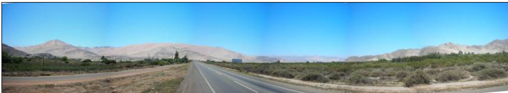
Fotografía 5.16-15: Vista al norte. Unidad Piedra Colgada-Cerros Bramador y Pichincha. A la Izquierda relieves de Sierra Ramadilla y Sierra Liga y a la derecha relieves de Loma El Lindero.