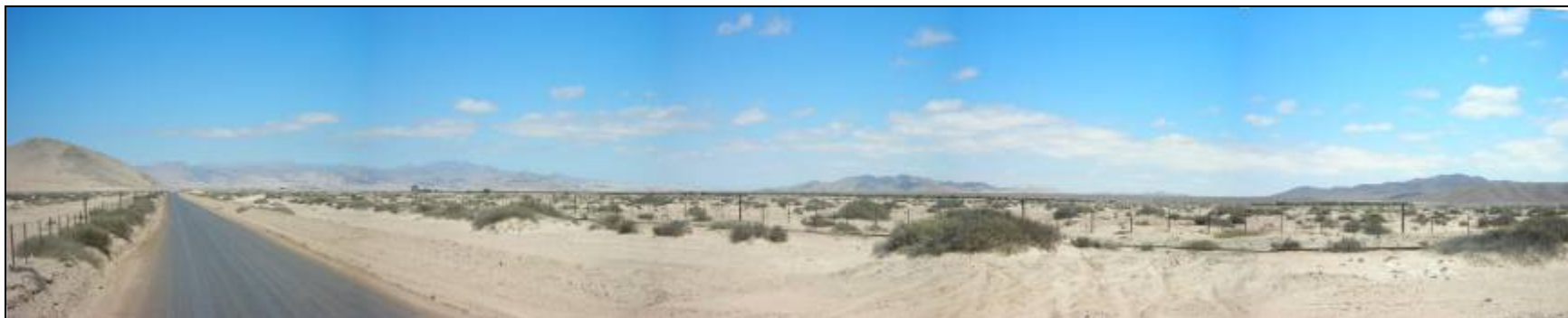
Fotografía 5.16-12: Vista al SE en Subunidad de Paisaje Valle Río Copiapó sector Monte Amargo-Piedra Colgada. En primer plano Llano de Las Liebres. Sector con vegetación nativa y dunas.