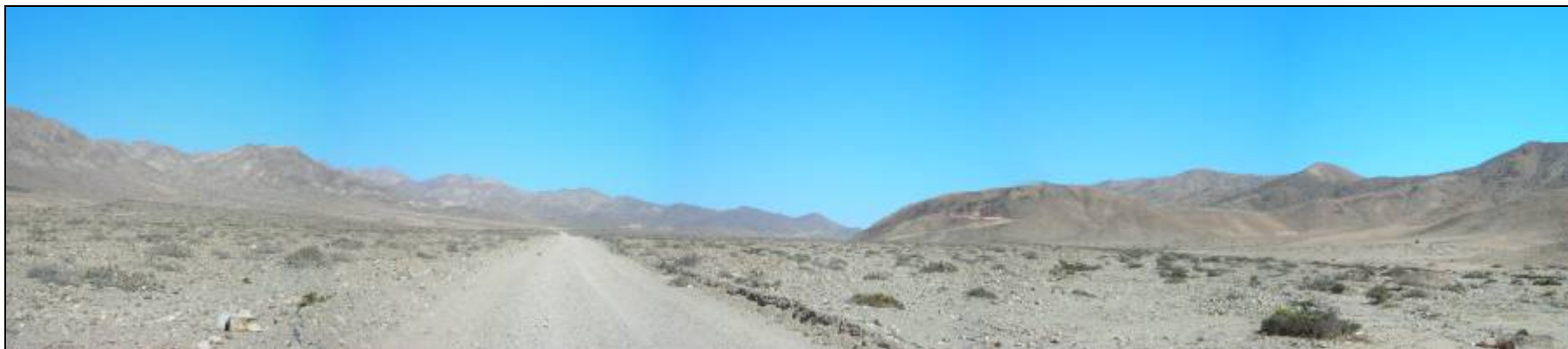
Fotografía 5.16-21: Vista al sur. Al fondo izquierda relieves de la Sierra Chicharra.