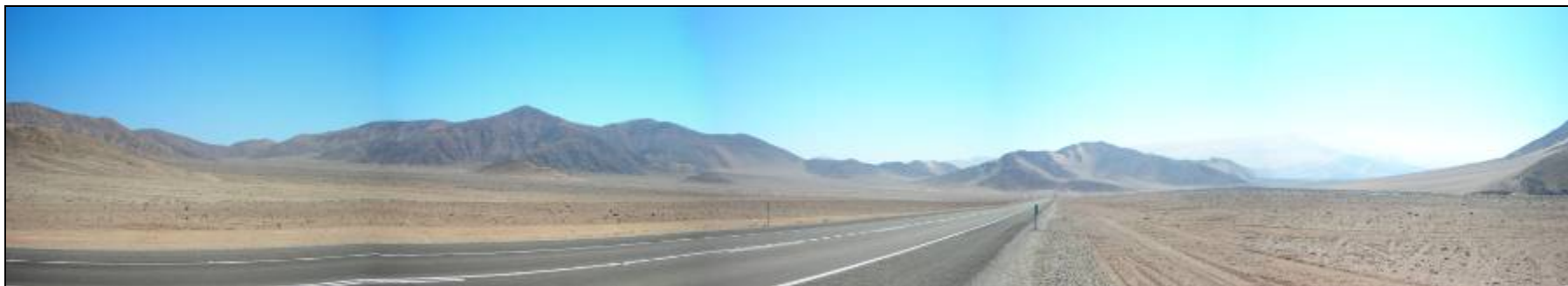
Fotografía 5.16-23: Unidad Llano en Sector Cerro Pata de Gallina. Vista al NO desde la Ruta C-386. Al centro izquierda Cerro Pata de Gallina perteneciente a la Sierra de Monardes.