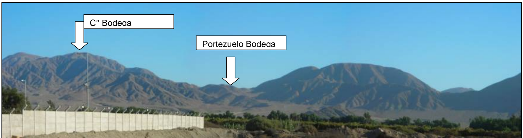
Fotografía 5.16-26: Vista hacia el sur desde carretera Ruta 5. Al fondo Rinconada de Bodega. Las flechas indican el Cerro Bodega y Portezuelo Bodega.