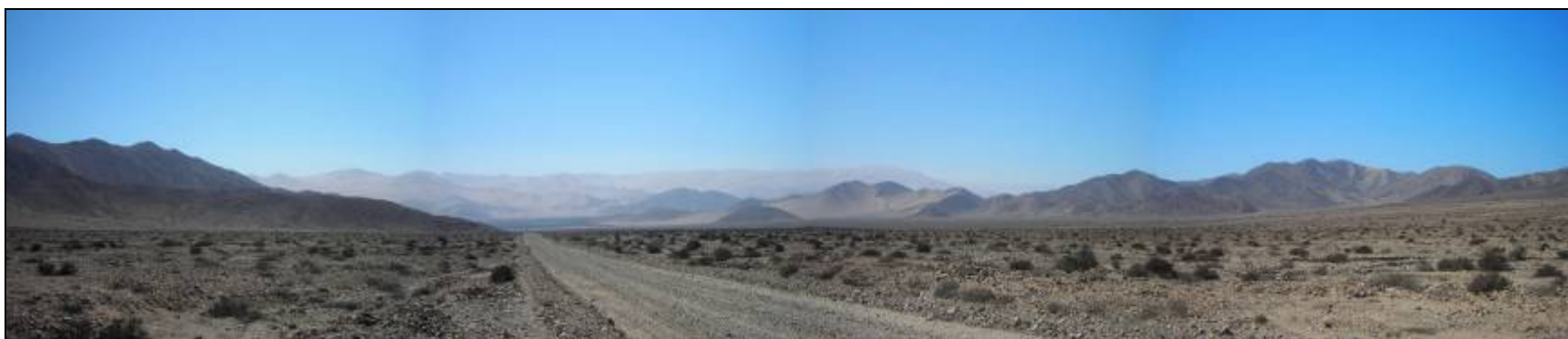
Fotografía 5.16-22: Vista al norte, hacia aguas abajo. Al fondo Sierra Piedra Colgada y Sierra Ramadilla.