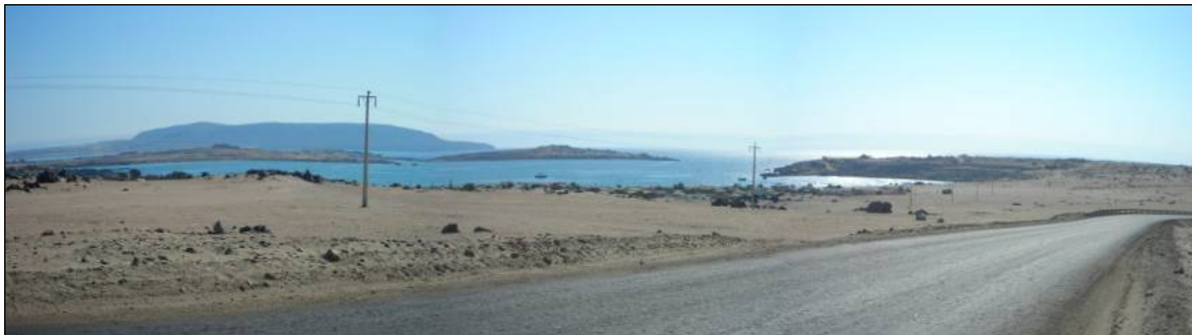
Fotografía 5.16- 6: Vista al sur. Unidad de Paisaje Bahía En primer plano Bahía de Calderilla. Al fondo Morro Copiapó.