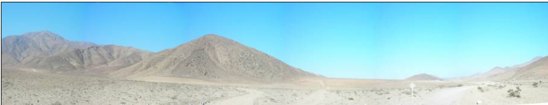
Fotografía 5.16-27: Vista hacia el sur desde carretera Ruta C-. Unidad Baja Montaña en Cordón de Cerros Monardes