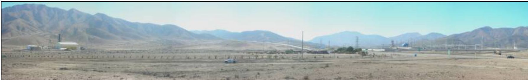
Fotografía 5.16-31: Vista al norte en costado Ruta 5. Subunidad 4, Sector Industrial Centrales Termoeléctricas.