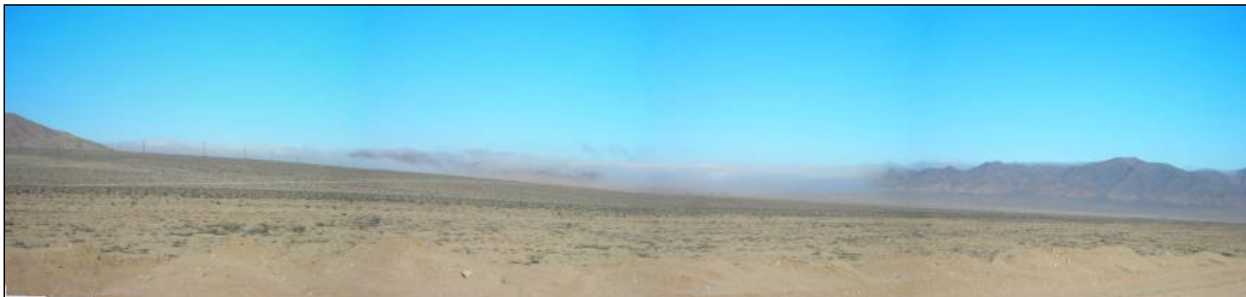
Fotografía 5.16-29: Unidad de Paisaje Llano Seco. Vista al sur en sector aledaño a SubUnidad Sector Industrial Centrales Termoeléctricas.