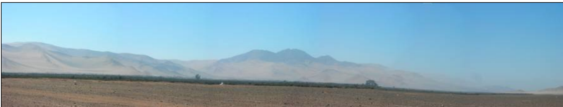
Fotografía 5.16-20: Vista al norte desde Unidad de Paisaje Llanos de la Isla Al fondo relieves de sierra Piedra Colgada y Cordón de Cerros Tío Ramos.