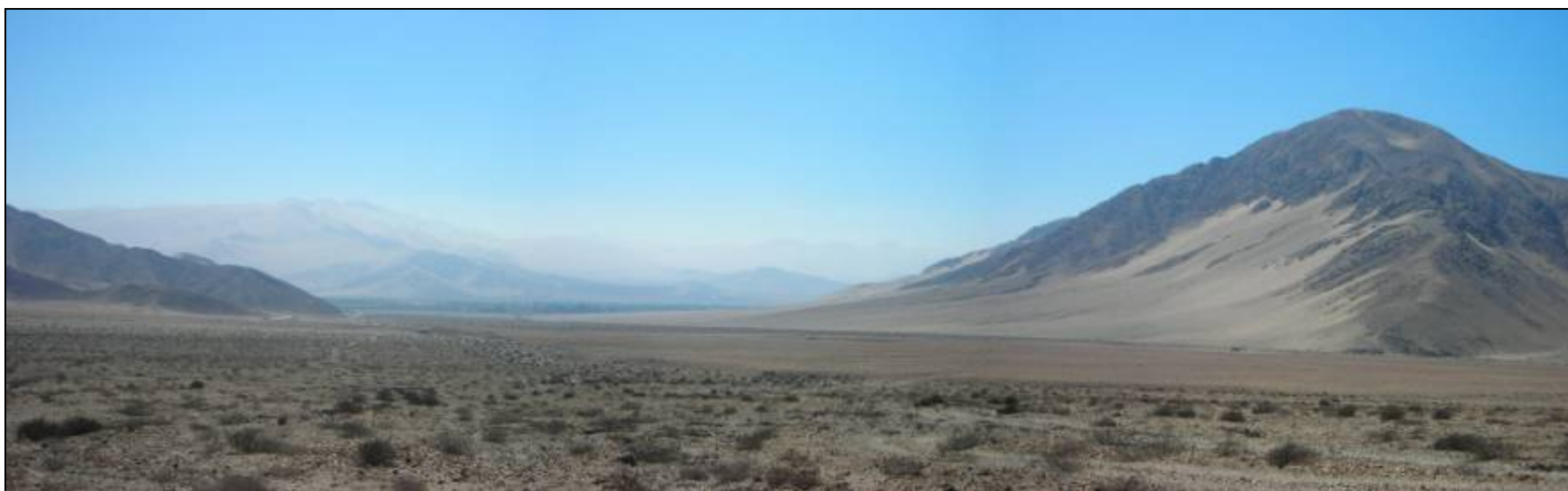
Fotografía 5.16-24: Unidad Llano en Sector Cerro Pata de Gallina. Vista al norte. A la derecha de la foto Cerro El Chanco. Al fondo Sierra Chamonate.