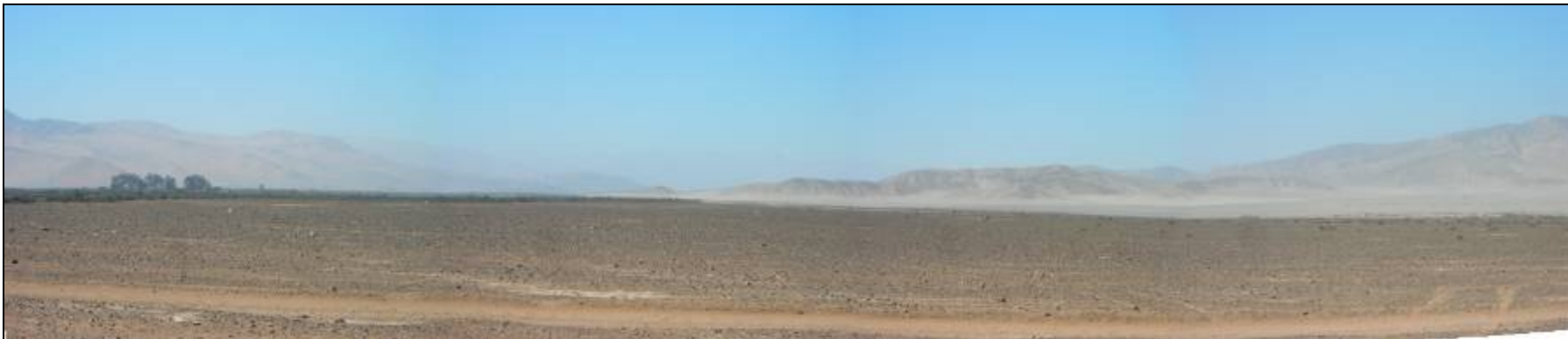
Fotografía 5.16-19: Unidad de Paisaje Llanos de La Liebre y de la Isla. Al fondo centro derecha estribaciones septentrionales de la Sierra de Monardes. Al centro izquierda valle del Río Copiapó se aprecia borde verde que contribuye e enmarcar la visual de la unidad hacia el norte y noreste.