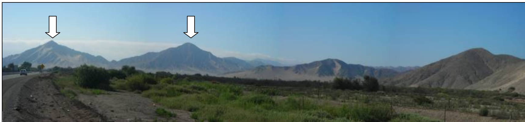
Fotografía 5.16-16: Vista al este en Unidad de Paisaje Piedra Colgada-Cerros Bramador y Pichincha. A la izquierda y centro cerros Bramador y El Chancho.