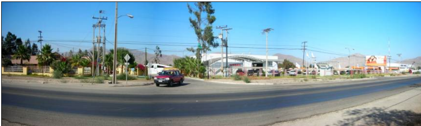
Fotografía 5.16-17: Vista al sur en Subunidad Valle Río Copiapó sectores Pichincha-Bodega