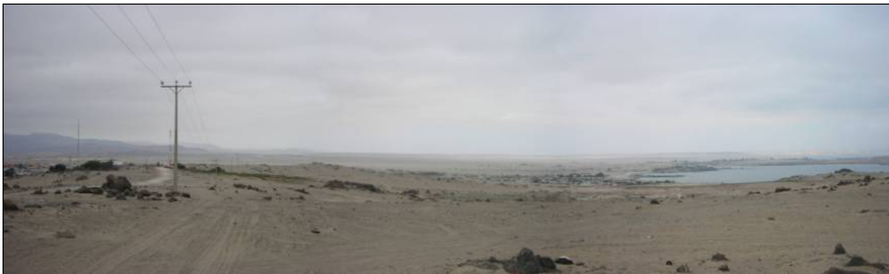
Fotografía 5.16- 7: Vista al sureste. A la derecha de la foto la localidad de Calderilla. Fotografía tomada en día nublado. Homogeneidad cromática.