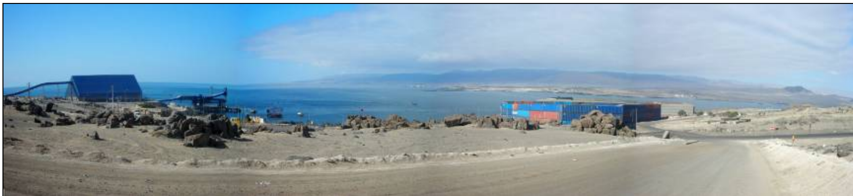
Fotografía 5.16-4: Vista al norte hacia la Bahía de Caldera. Unidad de Paisaje Puerto Punta Padrones