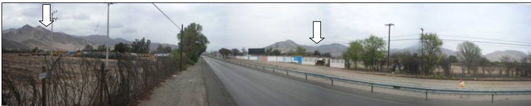
Fotografía 5.16-18: Vista al este en Unidad de Paisaje Valle Río Copiapó sectores Pichincha-Bodega. Al centro y derecha relieves de la Sierra Candeleró, a la izquierda Cerros Chanchoquin.