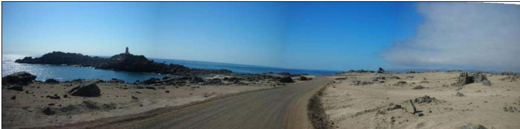
Fotografía 5.16-1: Vista al norte. Unidad de Paisaje Litoral Punta Caldera-Punta Zorro. Al fondo izquierda faro de Punta Padrones.