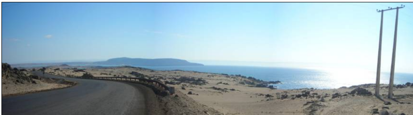
Fotografía 5.16-2: Vista al sur. Unidad de Paisaje Litoral Punta Caldera-Punta Zorro. Al fondo Morro Copiapó.