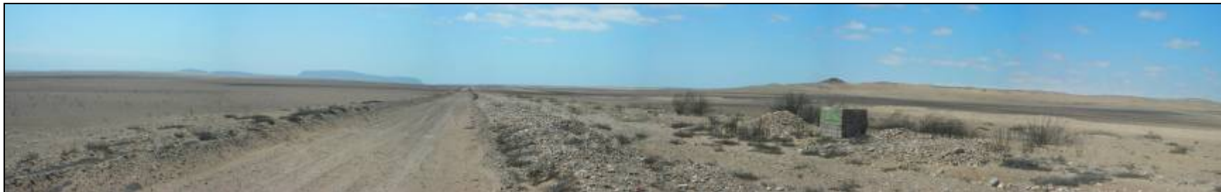
Fotografía 5.16-10: Vista al norte. Unidad de Paisaje Altos del Fraile-Los Eucaliptos en Llano de Caldera.