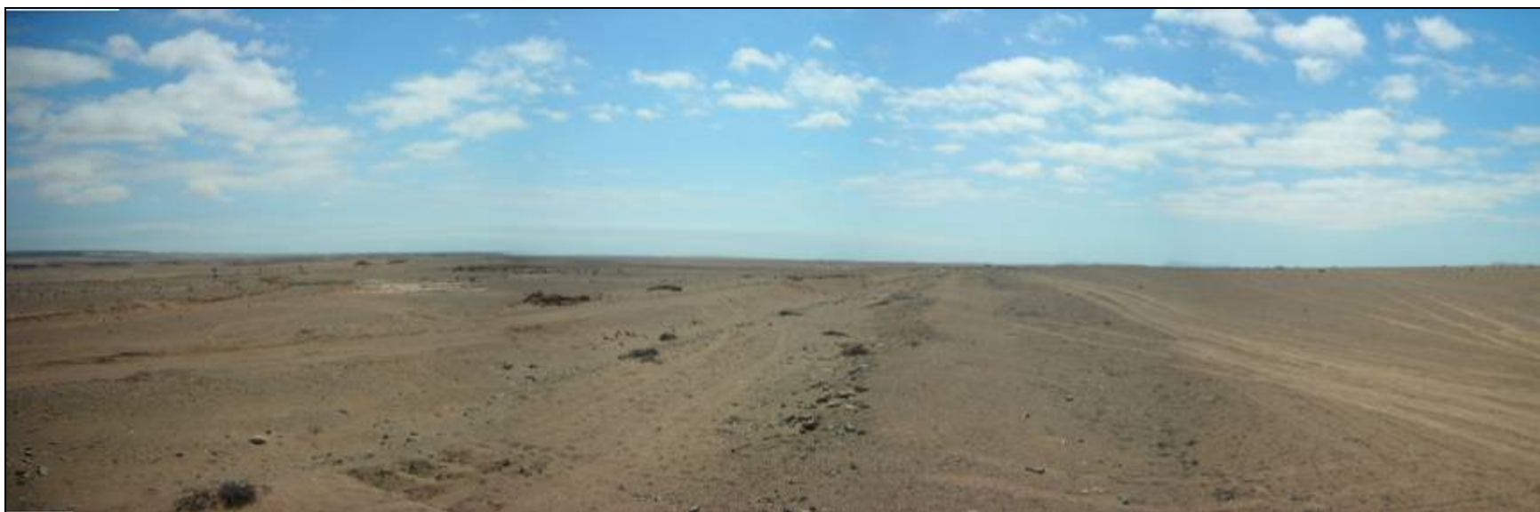
Fotografía 5.16- 11: Vista al norte. Unidad de Paisaje Altos del Fraile-Los Eucaliptos en Llano de Caldera.