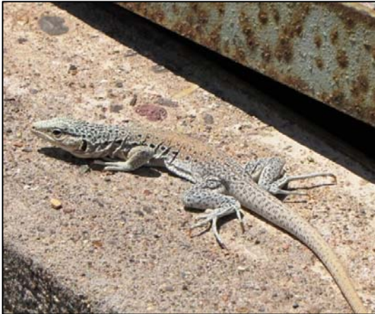
Fotografía 5.8-3. Ejemplar de la iguana chilena ( C. maculatus ) posado sobre una estructura antrópica.