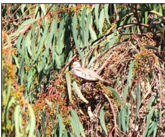
Fotografía 5.8-7. Hallazgo de la tortolita quiguagua ( Z. cruziana ) entre la vegetación.