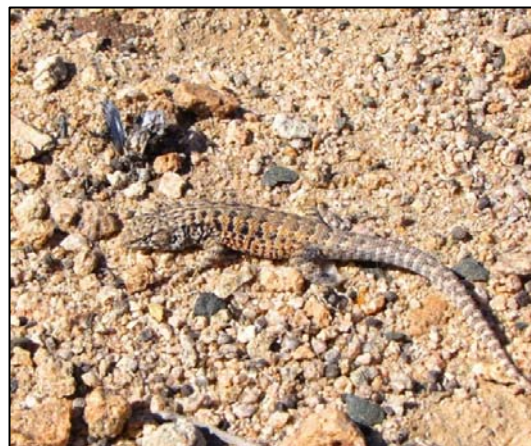
Fotografía 5.8-2. Ejemplar adulto de la lagartija de Plate ( L. platei ).