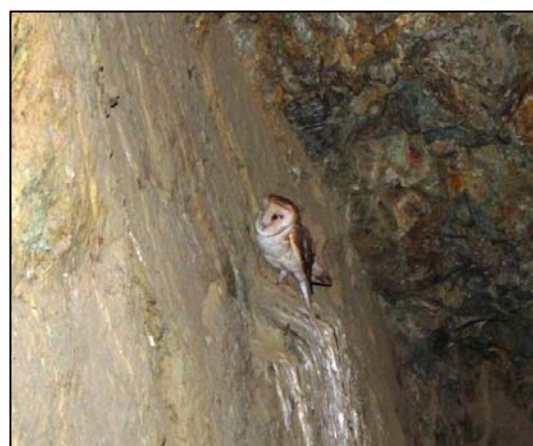
Fotografía 5.8-8. Lechuza blanca ( T. alba ) refugiada en un pique minero.