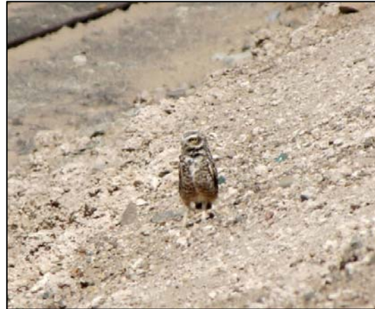
Fotografía 5.8-4. Pequén ( A. cunicularia ) parado junto a la antigua línea férrea