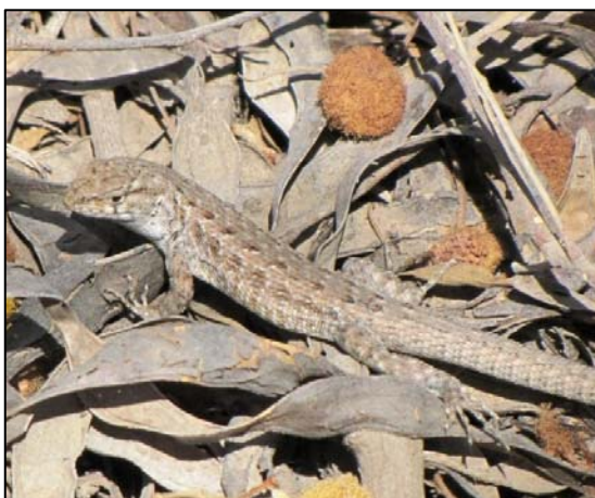
Fotografía 5.8-5. Individuo adulto de la lagartija de Veloso ( L. velosoi ).