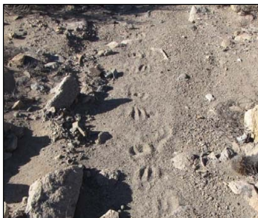
Fotografía 5.8-10. Huellas de guanaco ( L. guanicoe ) marcadas sobre un sendero.