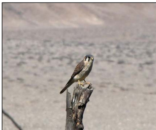
Fotografía 5.8-6. Ejemplar adulto de cernícalo ( F. sparverius ).