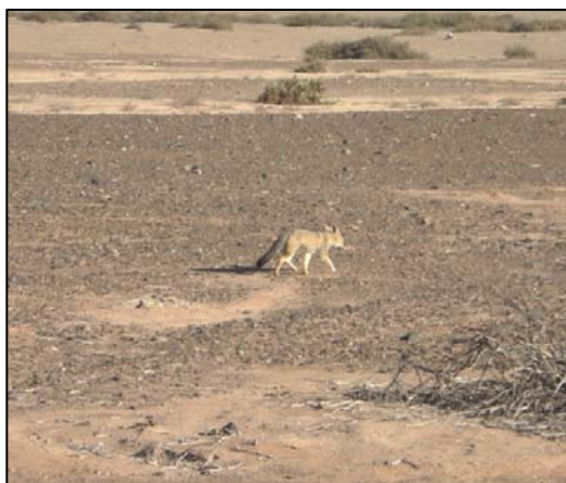
Fotografía 5.8-9. Ejemplar de zorro chilla ( L. griseus ) desplazándose por las llanuras.

Para la mastofauna, sobresale el hallazgo directo del zorro chilla ( Lycalopex griseus ; Fotografía 5.8-9 ), así como también la detección indirecta del guanaco ( Lama guanicoe ), localizado mediante huellas ( Fotografía 5.8-10 ). La liebre europea ( Lepus europaeus ), por su parte, se identificó a través de fecas.