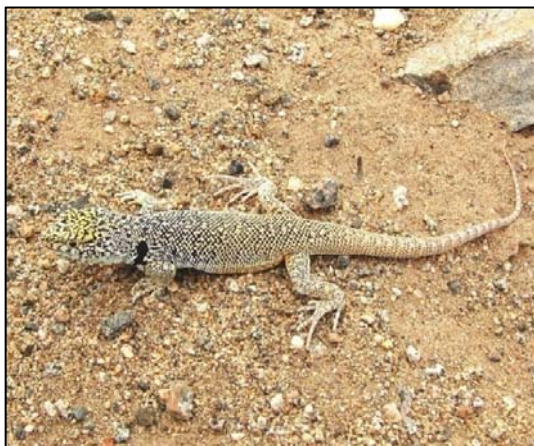
Fotografía 5.8-1. Macho adulto de la lagartija de dos manchas ( L. bisignatus ).

En relación a los mamíferos, sólo la liebre europea ( Lepus europaeus ) se detectó en forma directa, mientras que el zorro chilla ( Lycalopex griseus ) fue detectado a través de evidencias indirectas, principalmente fecas.